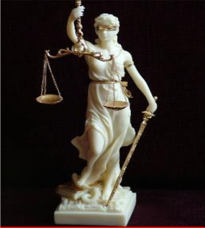
THEMİS ADALET TANRIÇASI

THEMİS HEYKELİNDEKİ: Kılıç" adaletin verdiği cezaların caydırıcılığını ve gücünü, "Terazi" adaleti ve bunun dengeli bir şekilde dağıtılmasını simgelemektedir. Themis'in "Kadın" ve "Bakire" olması bağımsızlığı ifade etmekte ve gözü bağlı olması da tarafsızlığını simgelemektedir. Hukukun evrensel ilkelerini simgesel olarak taşıdığı için Themis heykelinin adaleti en iyi şekilde ifade ettiğine inanılır.