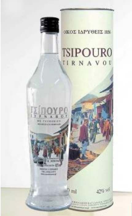
[Günün Bilgisi] Çipuro (Tsipouro)

7- Bilinciniz kapıdaki bekçidir. En önemli işlevi bilinçaltını, yanlış izlenimlerden korumaktır. İyi şeylerin olabileceğini ve şu anda olmakta olduğunu düşünmeyi her zaman tercih edin.