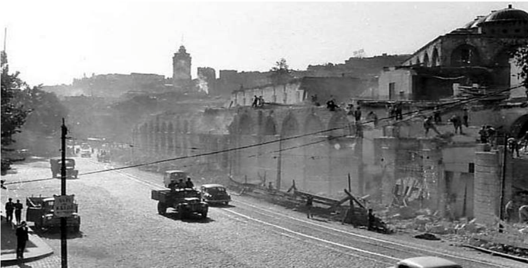
Istanbul Tophane 1957

Önümüzdeki hafta toplantımız: 31.Mart.2015 Salı saat 20.00 de Rotary Evinde.