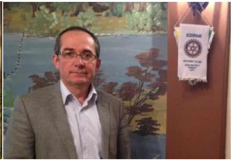
22.03.2015 Pazar günü düzenlenen Edirne Su Sempozyumu ile ilgili görseller