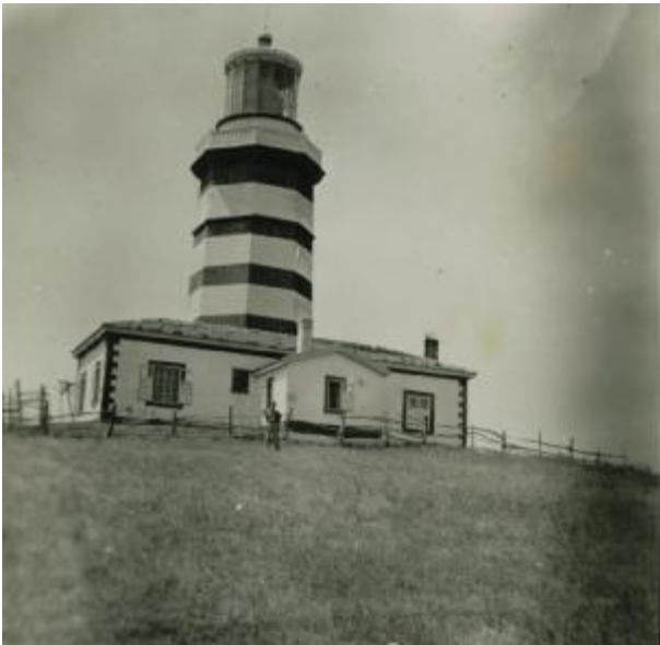
Şile Feneri 1955 öncesinde