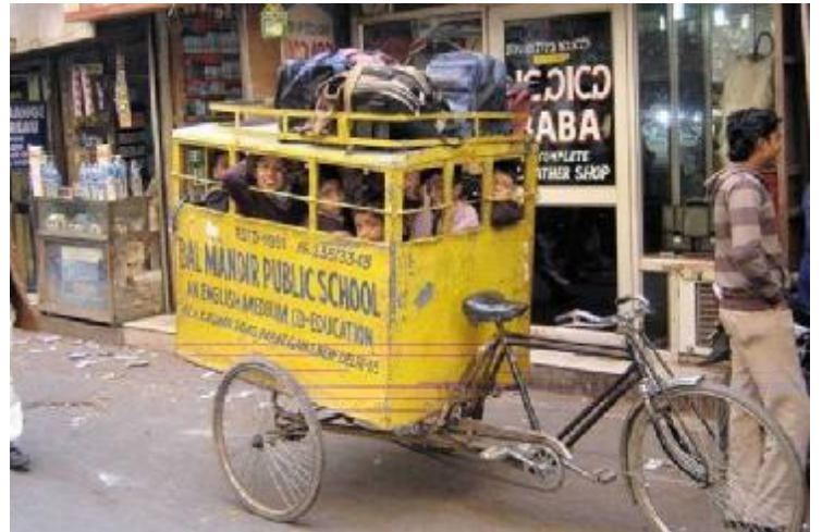
Pakistan da okul otobüsü

Önümüzdeki hafta toplantımız: 10.Mart.2015 Salı saat 19.00 de Rotary Evinde.