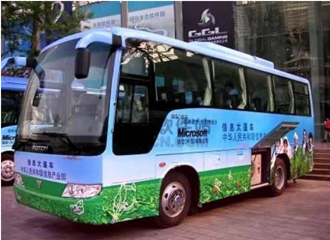
Japonya da okul otobüsü