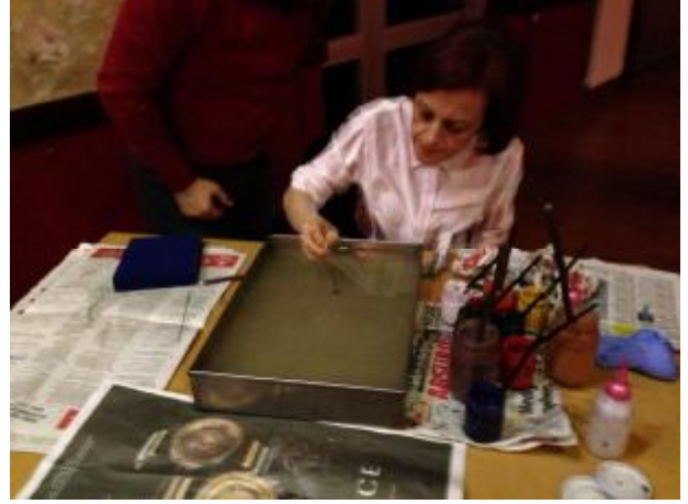
21.Şubat.2015 Çerkezköy Pasha Otel toplantısı görüntüleri