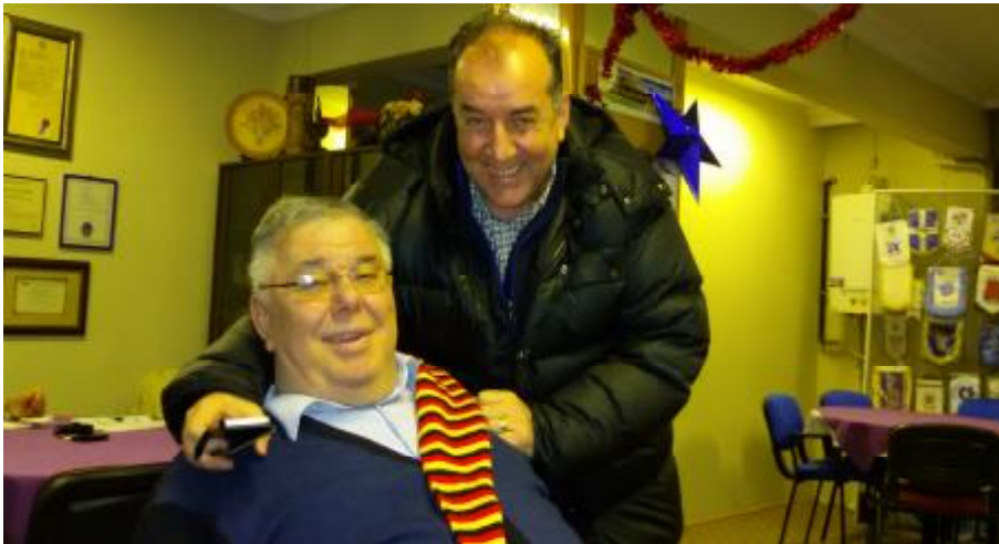
FENERBAHÇE - GALATASARAY DOSTLUĞU (Allah ayırmasın)