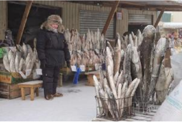
Kutuplarda balıkçı dükkanı

Türkler de ellerindeki parayla kürk almışlar ki Türkiye'ye geçtiklerinde kürkü satıp paralarının en azından bir kısmını kurtarabilsinler."