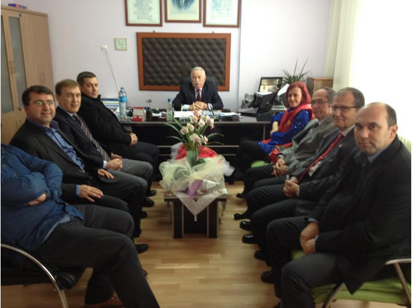
Perde teslimine katılan sevgili üyelerimiz..