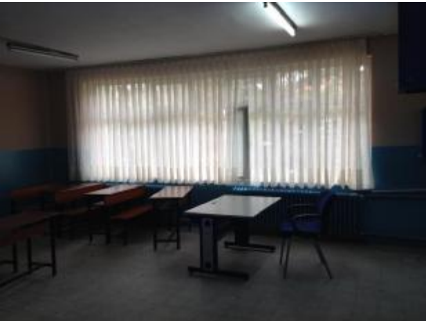
Perdeler takıldıktan sonra