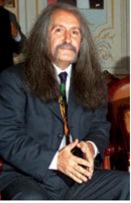
Ahmet BENAKMAN'ın katkısı ile

Barış Manço'nun bu müthiş cevabından sonra televizyon yöneticileri Canlı yayını keserler ve spikeri yayından alırlar, başka bir spiker yerine gelir ve canlı yayın yeniden başlar, yeni spiker Barış Manço'dan ve Türklerden özür diler,