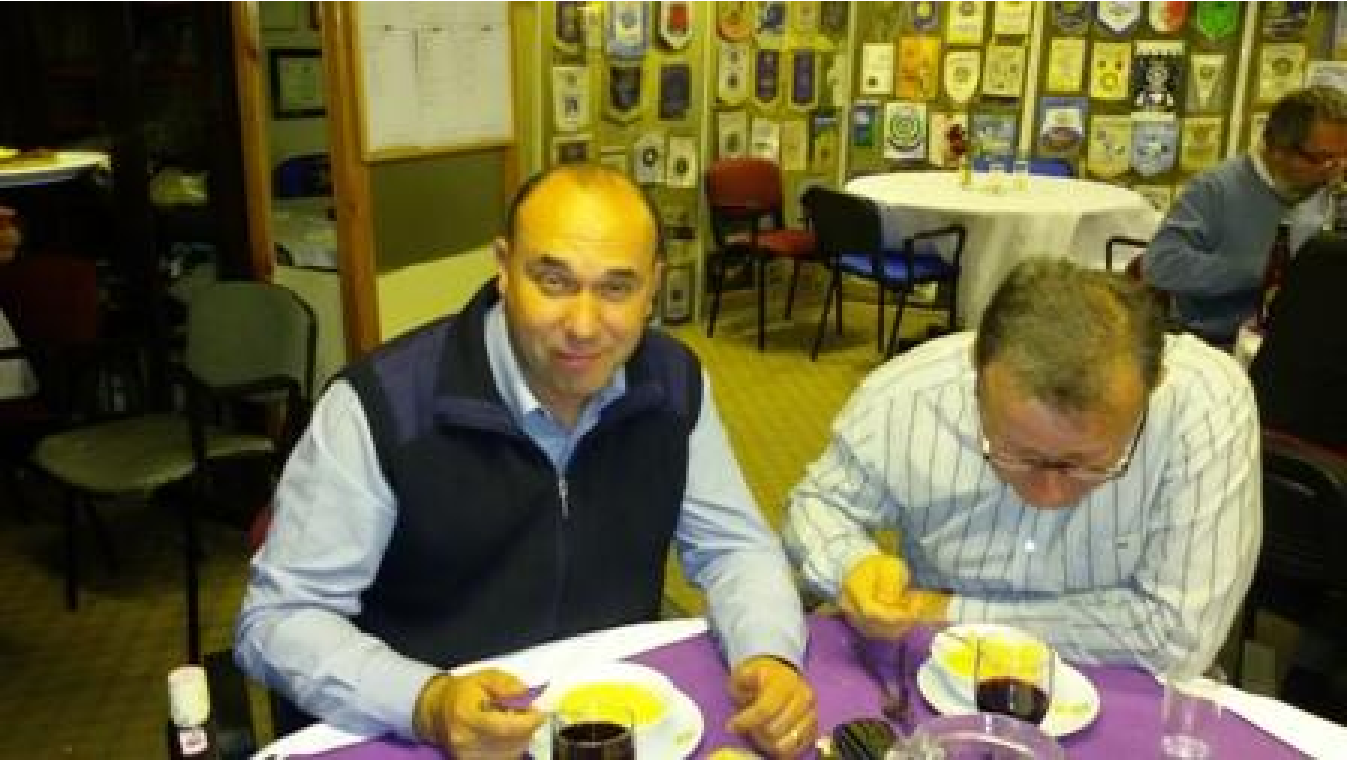
Kız tarafı üzüntüden,kendini çorbaya verdi.