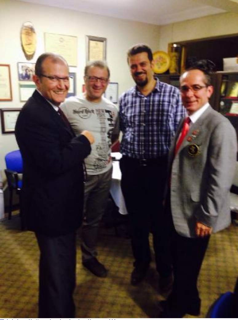
Tıbbiyeli üyelerimiz kuliste..!!!