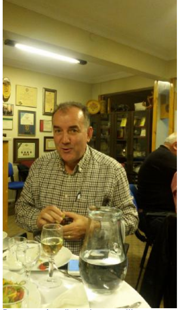
Damat tarafı su ile iştah açıyor..!!!