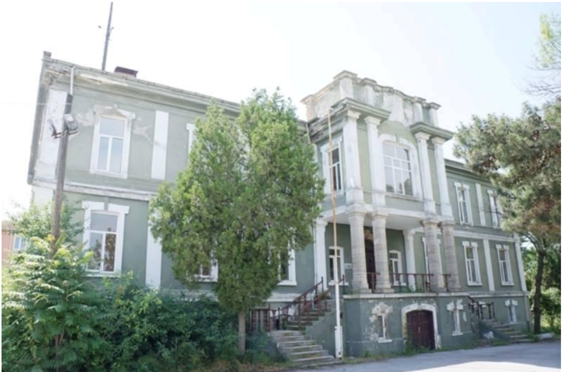
Edirne-General Adil Alpay (Sanayi) Kışlası.bugünü