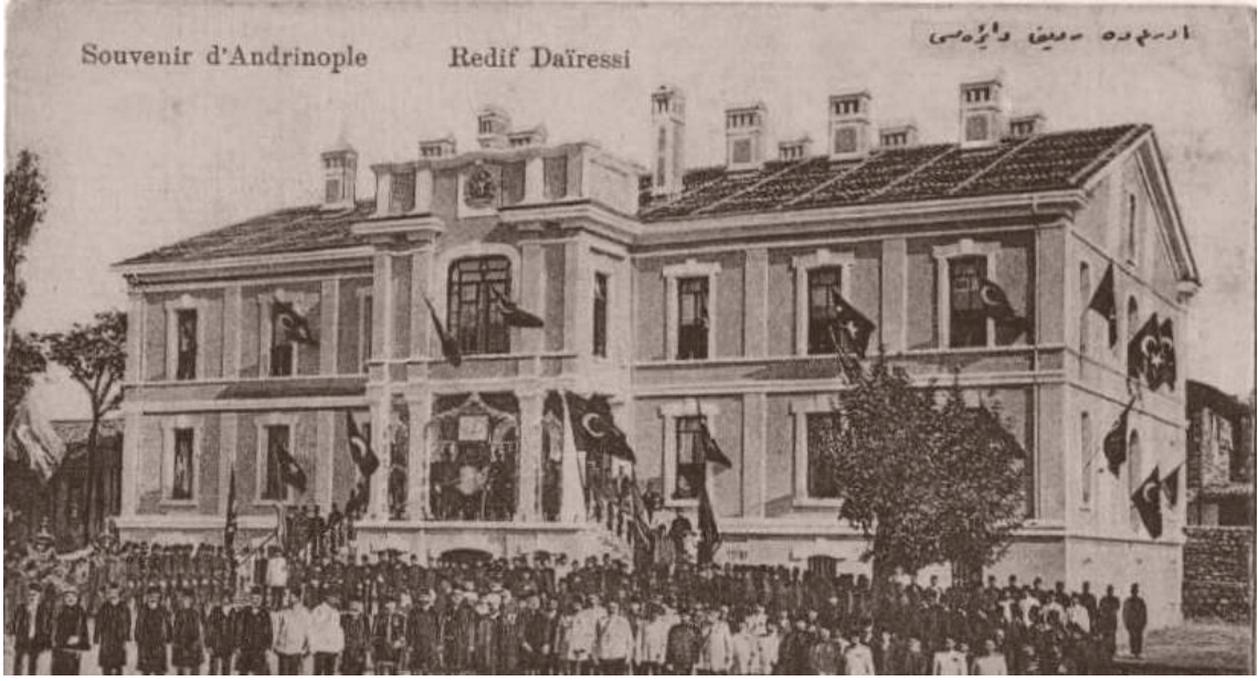
Edirne-General Adil Alpay (Sanayi) Kışlası. Dünü

Bakımsızlıktan sıvası dökülen bina, yeniden kullanılabilir hale getirilmesi için Edirne Müftülüğüne devredildi.