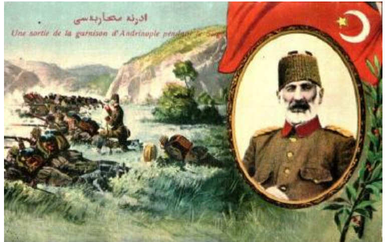
Şükrü Paşa Edirne Savunması