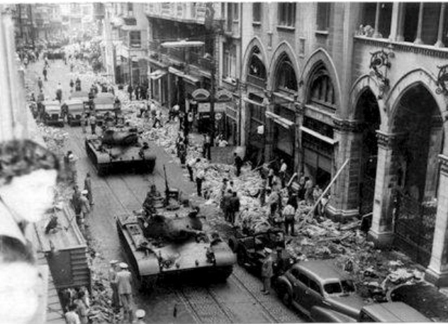
07.Eylül.1055 İstiklal Caddesi