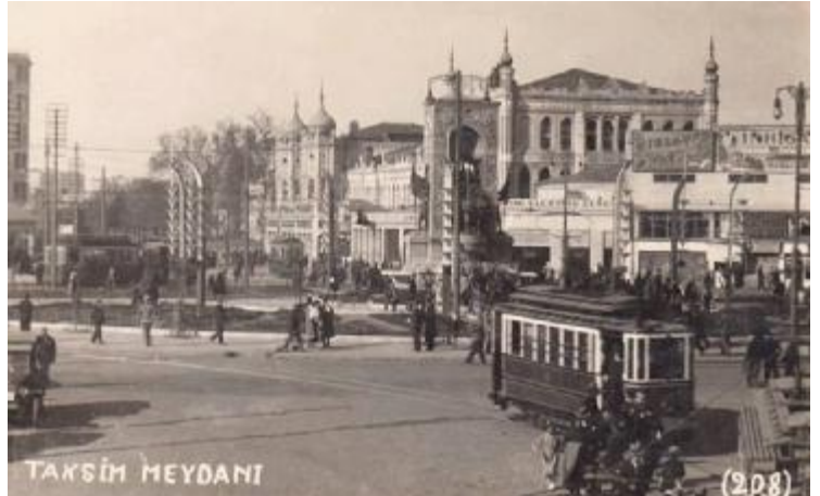
Bir zamanlar Taksim Meydanı