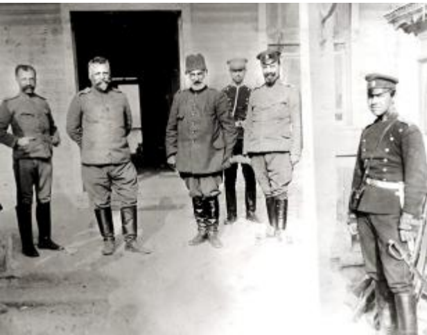
Şükrü Paşa Bulgar askerleriyle.

Böylece Edirne, Bulgaristan'a terkedilmiş oldu. Balkan Savaşı neticesinde Osmanlı İmparatorluğu'ndan elde ettikleri toprakları paylaşamayan Balkan Devletleri, yeniden, bu kez aralarında savaşılmaya başladılar. Bulgaristan, bir süre sonra Romanya ve Sırbistan'ın saldırısına uğrayınca, Edirne'yi boşaltmak zorunda kaldı. Bundan yararlanan Osmanlı Hükümeti harekete geçti ve Enver Paşa komutasındaki birliklerimiz 21 Temmuz 1913'te Edirne'yi işgalden kurtardı. 29 Eylül 1913'te imzalanan İstanbul Anlaşmasıyla da fiili durum resmiyet kazandı.