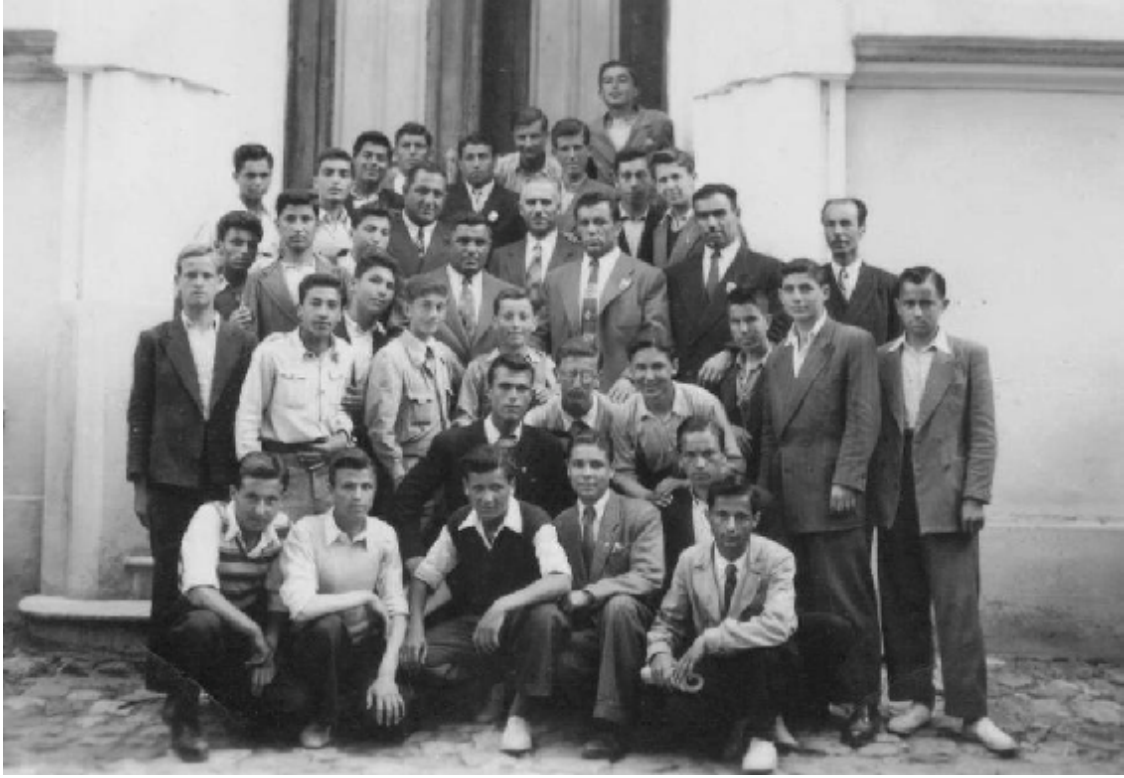
1948 YILI LONDRA OLİMPİYATLARINDA ŞAMPİYON OLAN GÜREŞÇİLERİMİZ, EDİRNE ERKEK ÖĞRETMEN OKULU'NDA. Tarih: 22 Mayıs 1949 (*)

11 Ağustos 1936'da yapılan Berlin Olimpiyat Oyunları'ndan sonra, 2. Dünya Savaşı nedeniyle olimpiyatlara on iki yıl ara verilmişti. Savaş sonrası gerçekleştirilen ilk olimpiyatlar, 29 Temmuz – 14 Ağustos 1948 tarihleri arasında yapılan Londra Olimpiyat Oyunları oldu.