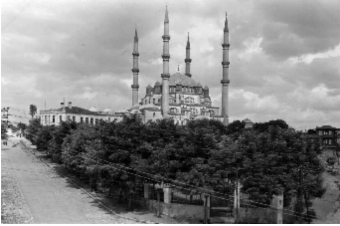
1935 yılında ki görüntüsü

Selimiye'nin etrafı açılırken okulda bu alanın içerisinde bulunuyordu. Bu nedenle okul binası 1965 yazında yıkılarak yeri yeşil saha haline getirilmiştir. Okulun yeni binası ise şimdi bulunduğu adreste 1964-65 öğretim yılına yetişmek üzere önce tek katlı ve 6 derslikli olarak yapılmıştır. 1966-67 öğretim yılında 2. Kat olarak 6 derslik daha eklenerek bugünkü halini almıştır.