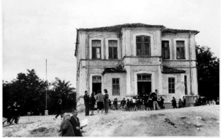
yıkılmazdan önceki son görüntüsü. ( arka cepheden)