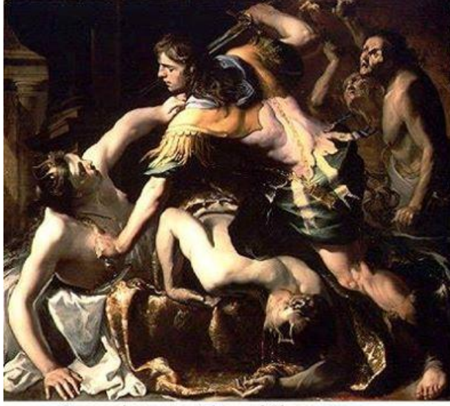
Orestes slaying Aegisthus and Clytemnestra