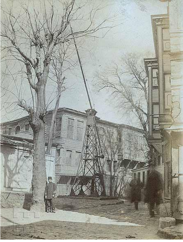
Zincirlikuyu ismini bu fotoğraftan almaktadır, tarih 1900