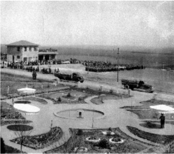
Göçebe Enstitü: Kepirtepe

1937 yılında Edirne-Karaağaç'da Eğitim Kursu ve Trakya Köy Öğretmen Okulu açılır. Okul ve Kurs önce Alpullu'ya, daha sonra Lüleburgaz'a nakledilir. Okulun Kepirtepe'ye kurulmasına karar verilmesiyle birlikte binalar yükselmeye başlar.