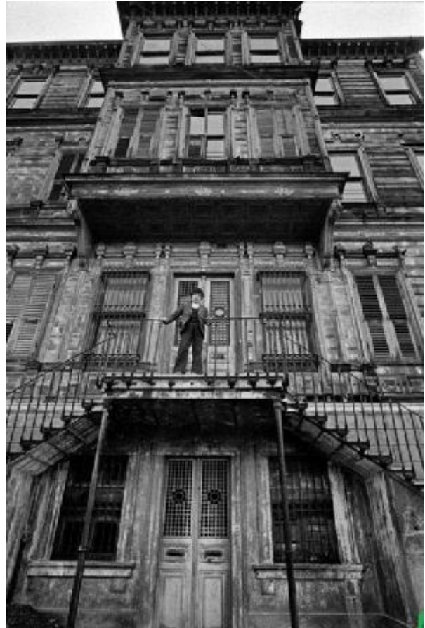
KANDİLLİ - 1985...