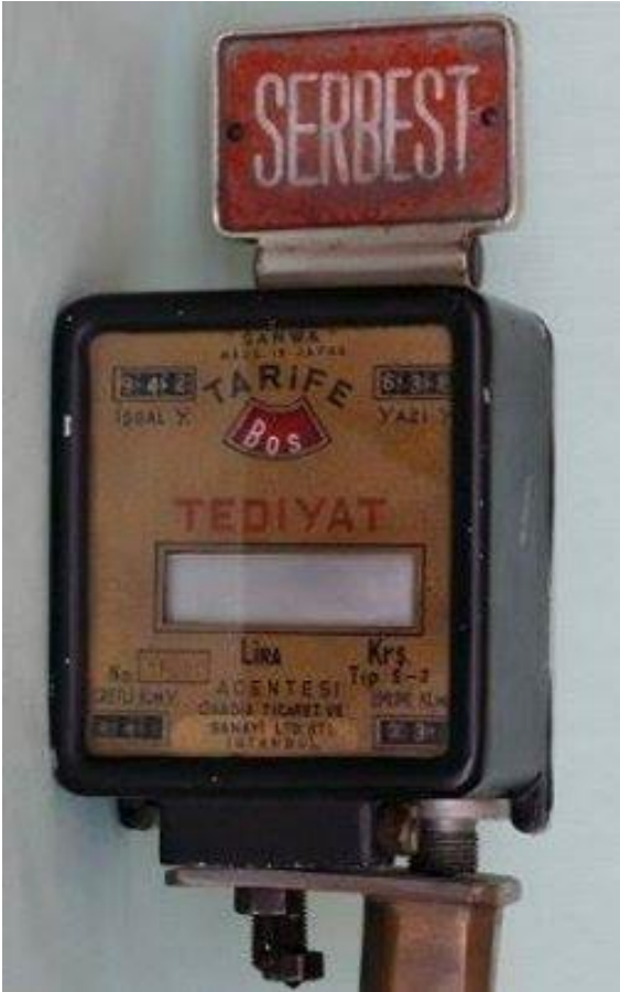
O yıllarda taksilerin sağ tarafındaki TAKSİMETRE