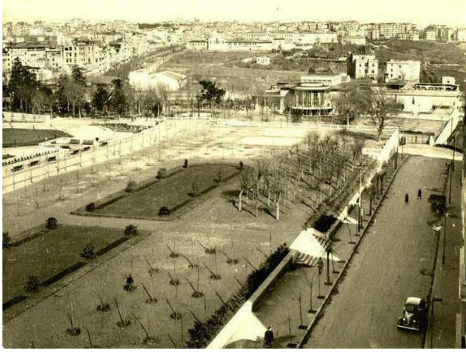
Gezi Park'ında sökülmeye çalışılan ağaçların 70 yıl önceki dikim anı -1943