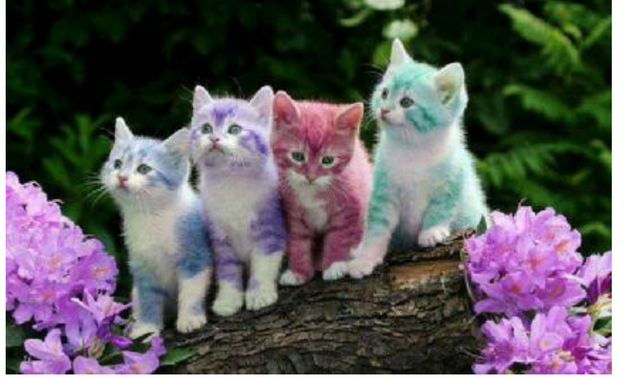
Merdivenleri boyayalım diye başladık, kedileri boyamışık