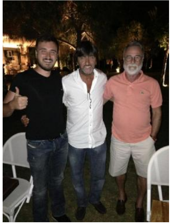
REYHAN ve ŞEYTAN