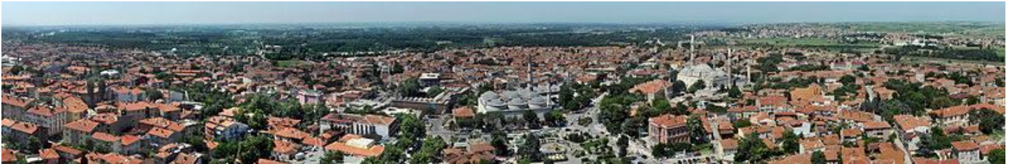
SELİMİYEDEN EDİRNEİN PANORAMİK GÖRÜNTÜSÜ