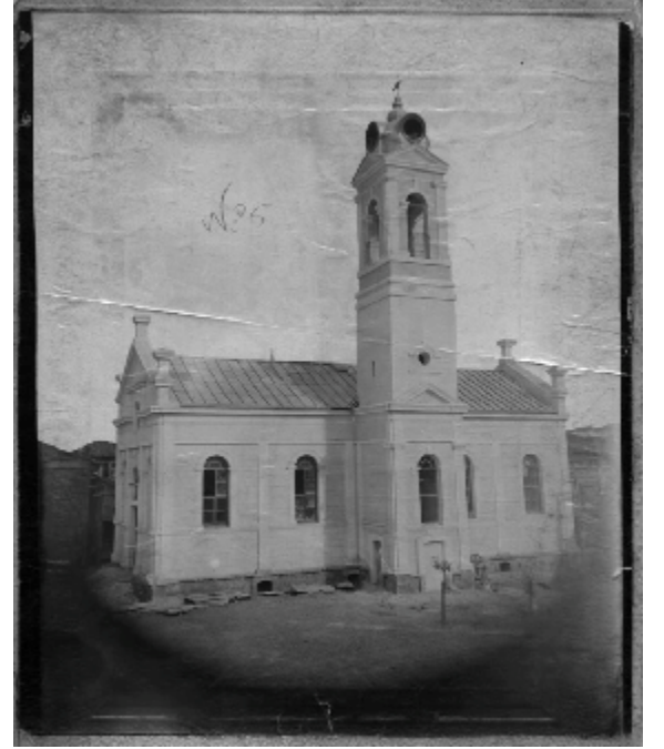
lise içerisinde bulunan şimdiki konferans salonu olarak kullanılan yerde ki kilise binası