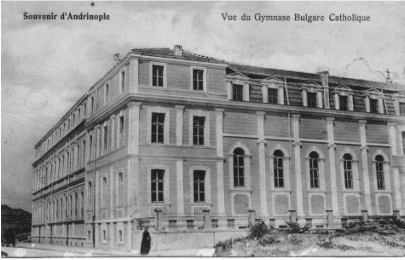
1. murat lisesi 1900 yıllar

Yeni bir kozmetik ürün alırken sadece bu kareciklere bakarak ürünün ne oranda kimyasal içerdiğini anlayabilirsiniz.