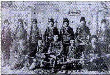
1859: Zeytin’de İLK ERMENİ İSYANI Cesaret veren ve kışkırtan III’cü Napolyon’dur!

Bu kişiyi yakından tanımak ve bilmek, günümüz Avrupa’sında meydana gelen ve hatta gelebilecek olayları anlamak isteyen her Türk aydını için kaçınılmaz bir görev olmalıdır. İşte bu nedenle biz bir sonraki yazımızda bu kişiyi ele almanın ve değişik yönleri ile sizlere tanıtmanın yararlı olacağına inanıyoruz.