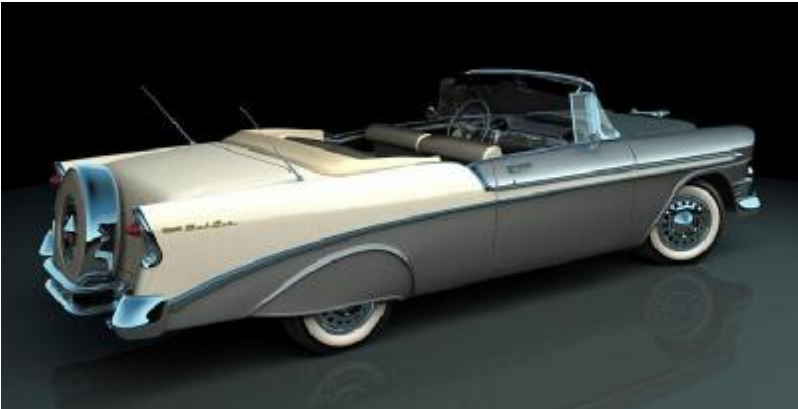
1956 Chevrolet Bel Air Convertible

Önümüzdeki hafta toplantımız: 25.Eylül.2011 Salı Saat 20.00 Rotary Evinde