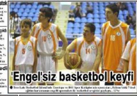
Engel'siz basketbol keyfi