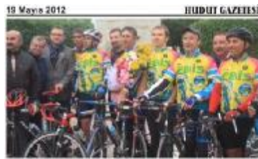
EBİS'ten 'saygılı' finiş