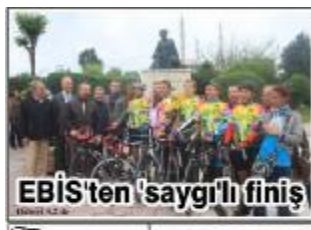
EBİS'ten 'saygılı' finiş