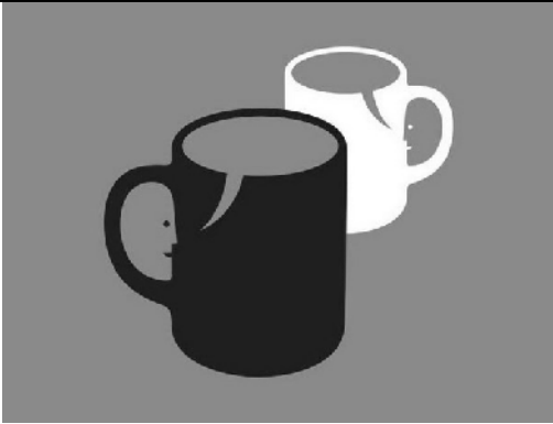
Tea for Two