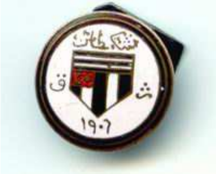
1906 YILI ROZETİ ÖN YÜZ