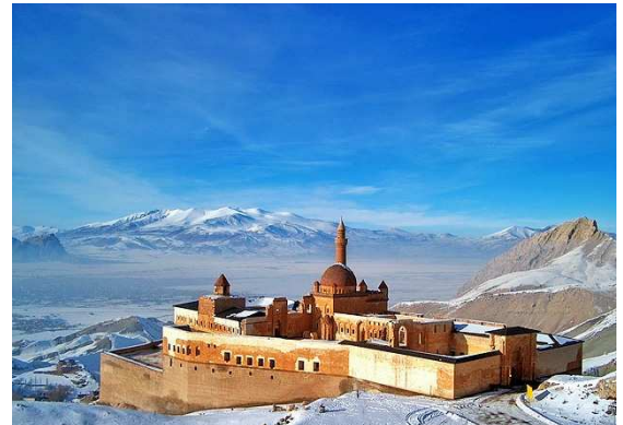
İSHAKPAŞA SARAYI KIŞ GÖRÜNÜMÜ